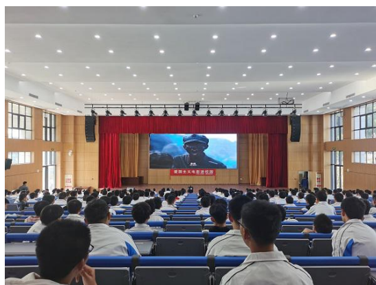
在报告厅观看《血战湘江》