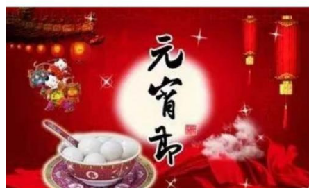
喜迎建党一百年，欢度元宵灯谜会

2021年是中国共产党建党一百周年，为庆祝共产党百年华诞的重大时刻，借此元宵佳节到来之际，安徽材料工程学校开展“喜迎建党一百年，欢度元宵灯谜会”活动。我们将在参与活动的师生中选取一等奖10名，二等奖20名，三等奖40名，并颁发荣誉证书。欢迎您积极参加！