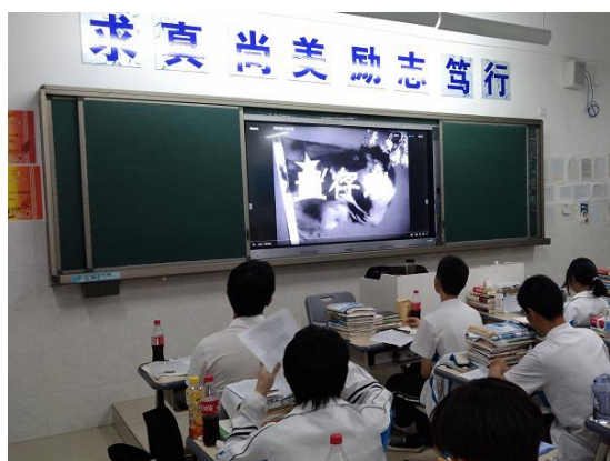
在教室观看《董存瑞》